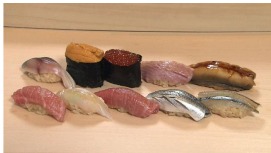
今回のおまかせ10貫